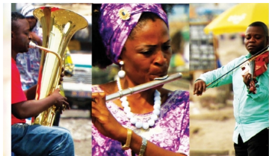
Läuft außer Konkurrenz auf dem Filmfest: Kinshasa Symphony.

Kinshasa, drittgrößte Stadt Afrikas, Hauptstadt der Demokratischen Republik Kongo. Fast zehn Millionen Menschen leben hier – die meisten in bitterer Armut. Umso erstaunlicher, mit wieviel Improvisationstalent, Liebe und einem festen Willen, durchzuhalten, sich das einzige Symphonieorchester Zentralafrikas dort formiert hat: Das L'Orchestre Symphonique Kimbanguiste. Claus Wischmann und Martin Baer haben eine wunderbare Dokumentation über dieses Orchester gedreht: "Kinshasa Symphony". Der Film läuft auf dem Filmfest Emden-Norderney zwar außer Konkurrenz, das Herz von Nordwestradio-Reporterin Nicole Ritterbusch hat er trotzdem gleich erobert.