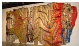
El Anatsui: In the world but don't know the world, 2009